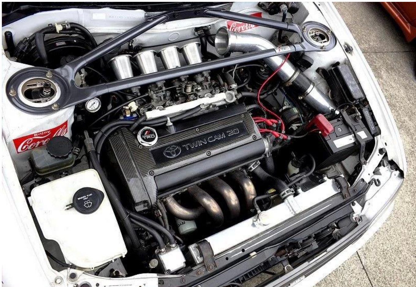
Примечание: Картина из Pinterest.