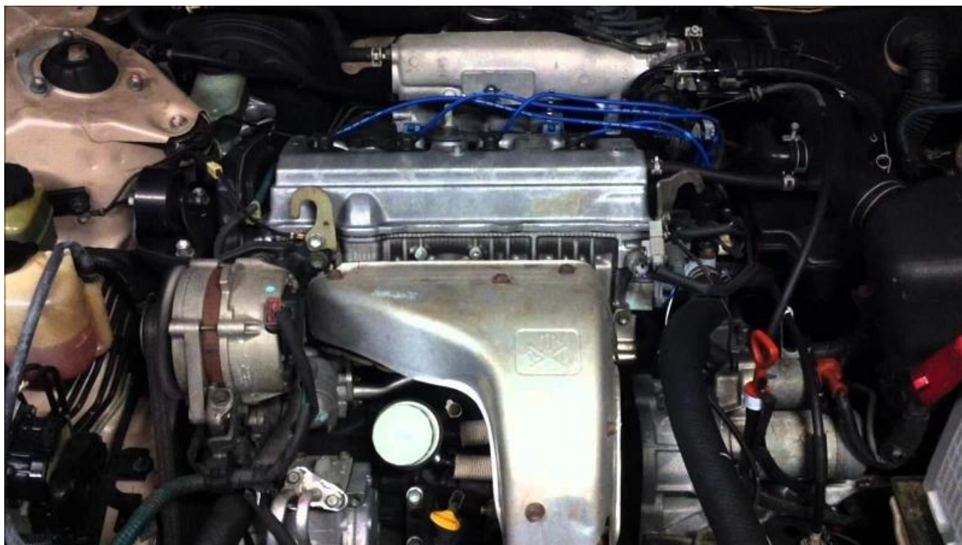
Замечания: Рисунок от Pinterest.