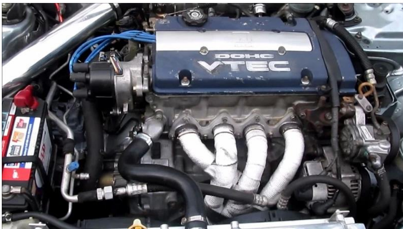
Замечания: картина с Youtube