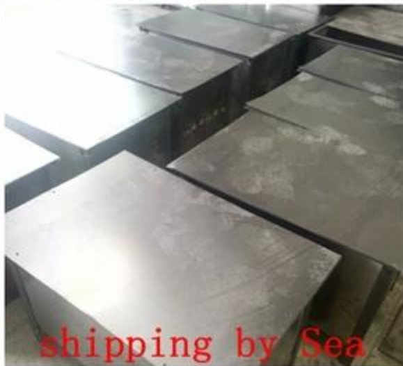
shipping by Sea