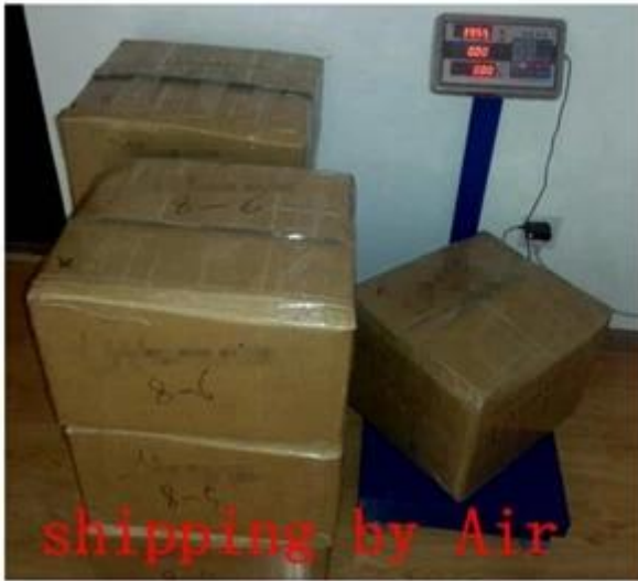
shipping by Air