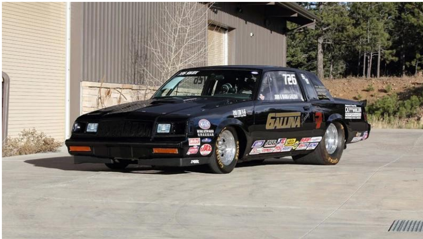
Nota: Immagine all'asta di Mecum