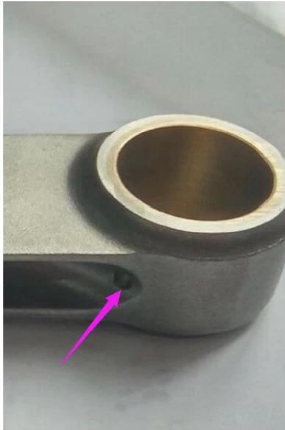
Due piccoli fori per l'olio praticati nella piccola trave di estremità tagliata per una buona lubrificazione.