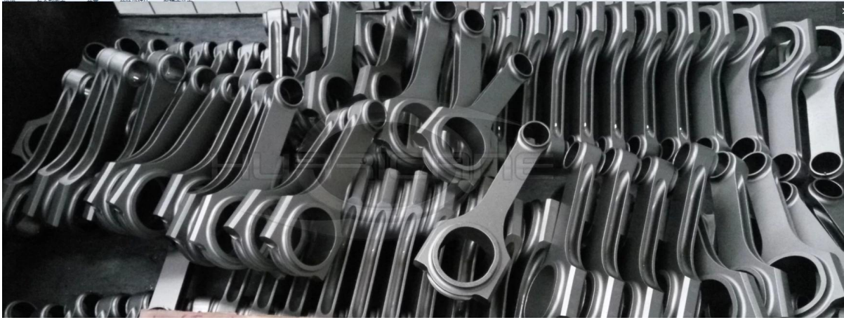
Questo è un ragano Hf fasciato bielle dopo il trattamento a pallinatura.