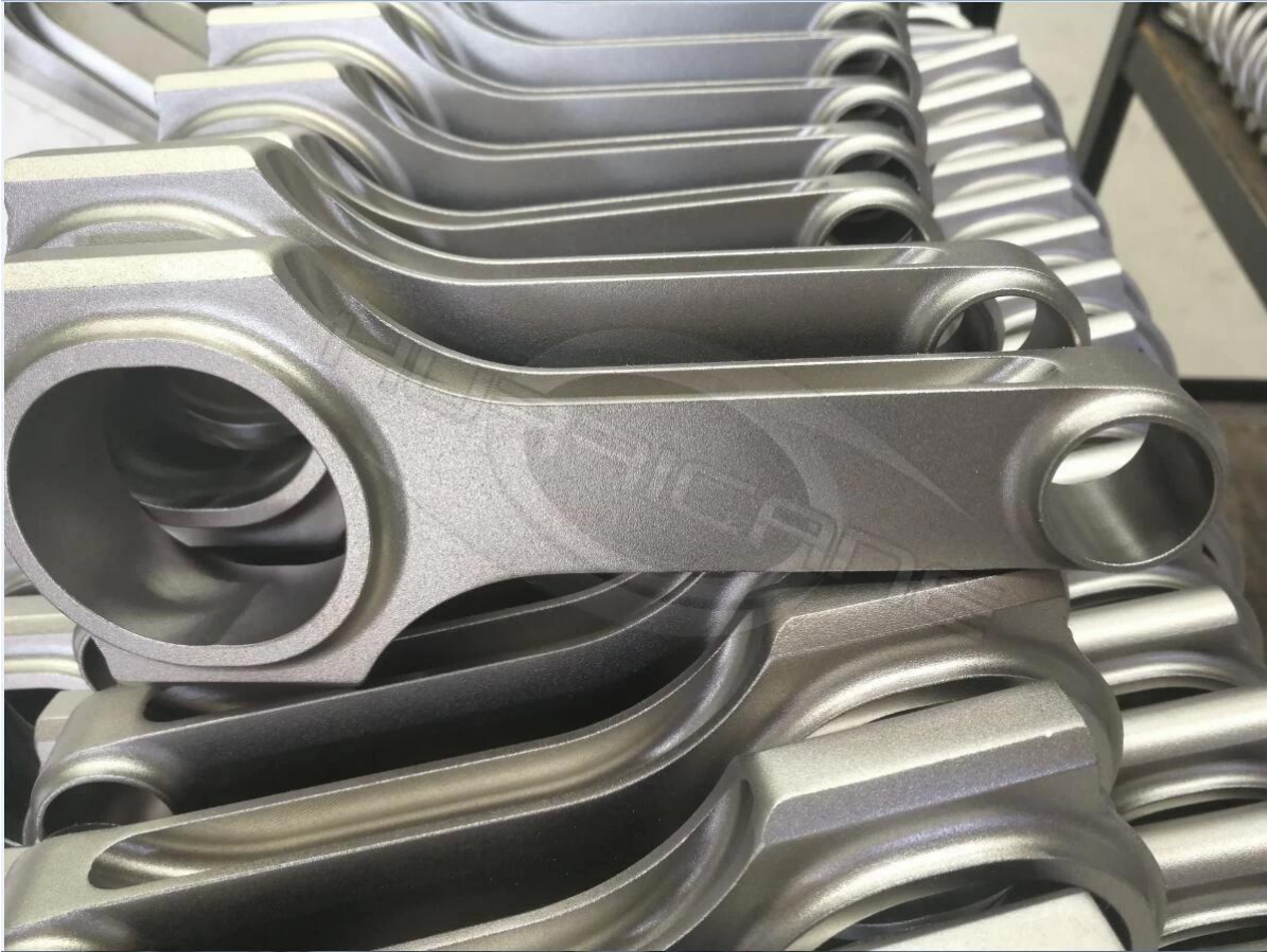
Foto di bielle finite : Le estremità grandi e piccole sono completamente affinate dalla macchina SUNNEN. Manicotti di centraggio ad alta resistenza montati nel cappuccio dell'asta per collegare trave e cappuccio dell'asta.