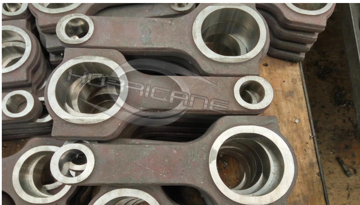
Foto di forgiati 4340 di alta qualità: ogni pezzo fucinato è sottoposto a raggi X, testato sonico e magnafussato.

Le bielle Hurricane GM Chevy SBC Hurricane sono forgiate in materiale d'acciaio 4340 ad alta resistenza, interamente lavorate a CNC per essere più affidabili nei campi automobilistici. Ogni asta è boccola in bronzo per applicazioni completamente flottanti, pallinata per migliorare la resistenza a fatica, trattata termicamente con 34-38HRC per una maggiore resistenza, dimensionata ispezionata per un'elevata stabilità.