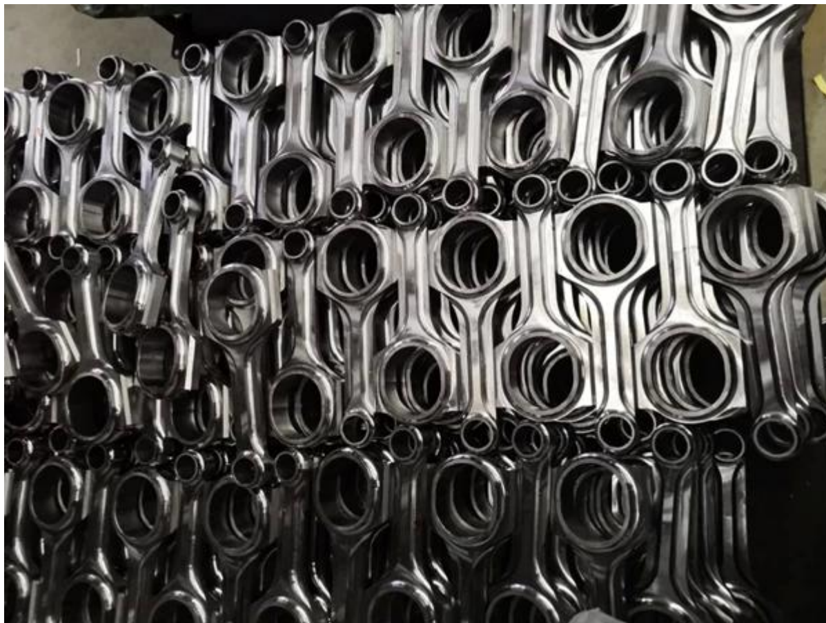
Aste di collegamento del raggio X finito