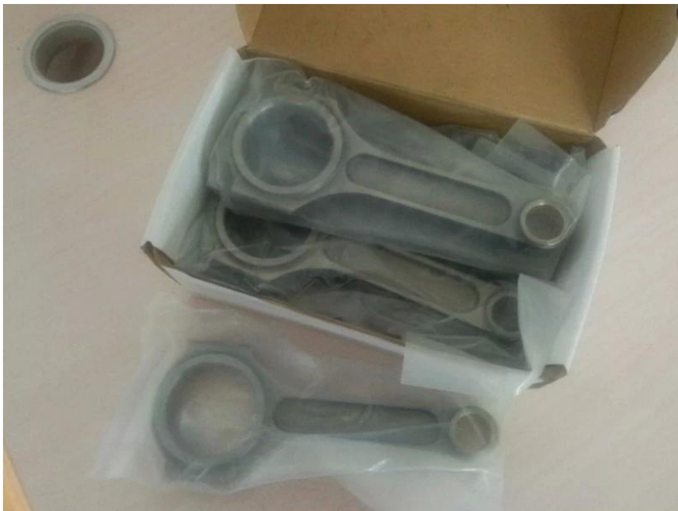
Immagine dell'automobile dell'orizzonte di Nissan