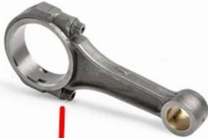
OEM connecting rods

de conexión completamente balanceadas podía ser proporcionado para emparejar su cigüeñal de Volkswagen, hojeador por favor todas nuestras categorías refrescadas aire del motor de Volkswagen de las piezas para terminar su proyecto de la reconstrucción del motor de VW de OEM a las barras del alto rendimiento.