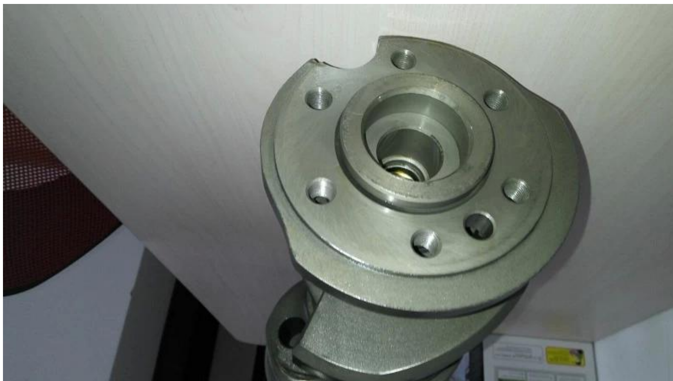
Caza 350 Motor Imagen