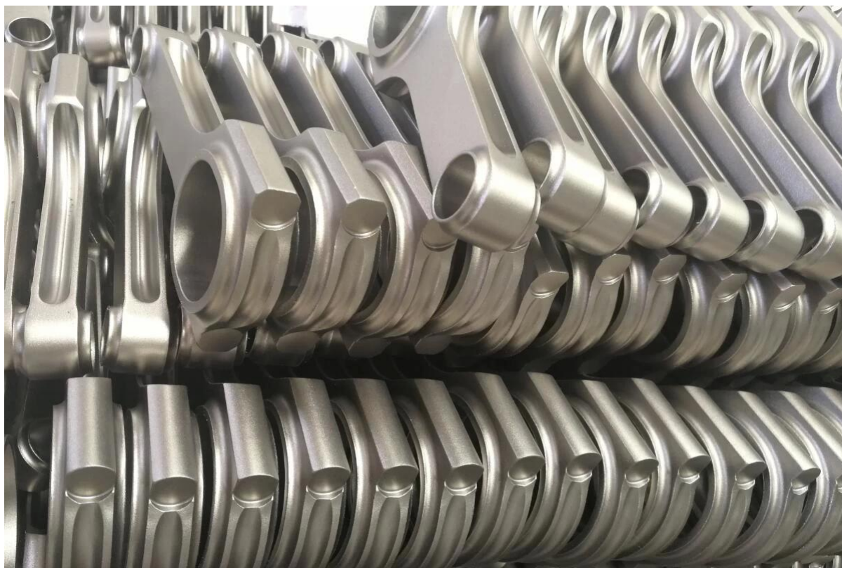
Paquete minorista de rendimiento y velocidad de huracanes