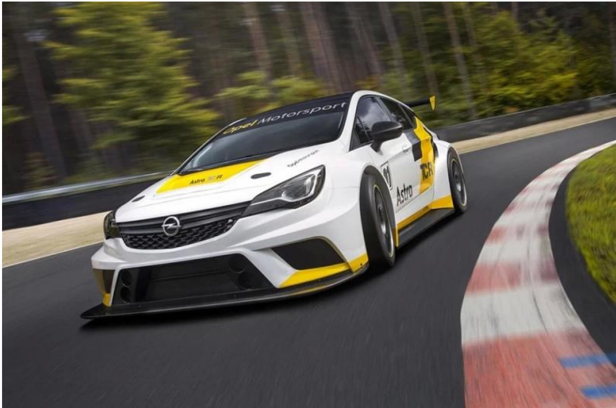
Imagen del coche de carreras de Opel Astra TCR