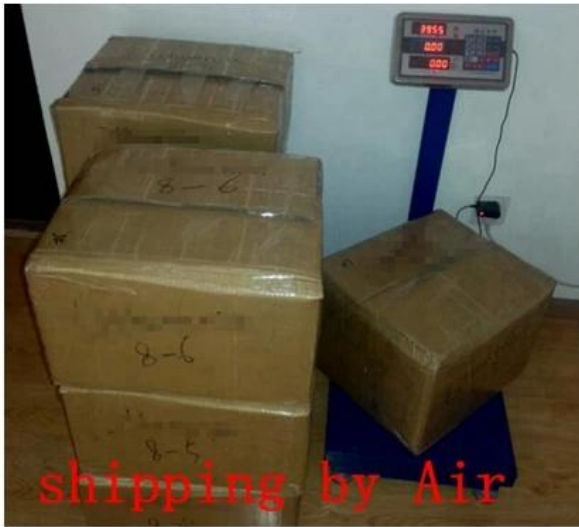
shipping by Air