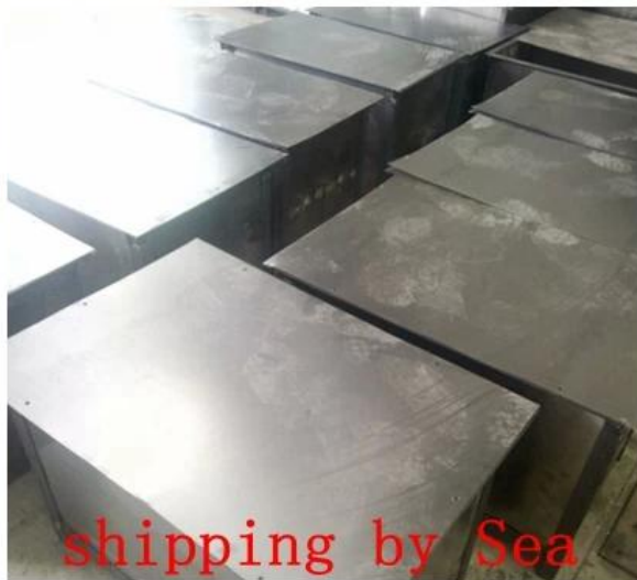
shipping by Sea

El embalaje personalizado es aceptable, no dude en correo electrónico nosotros para conocer más detalles si tiene algún interés.