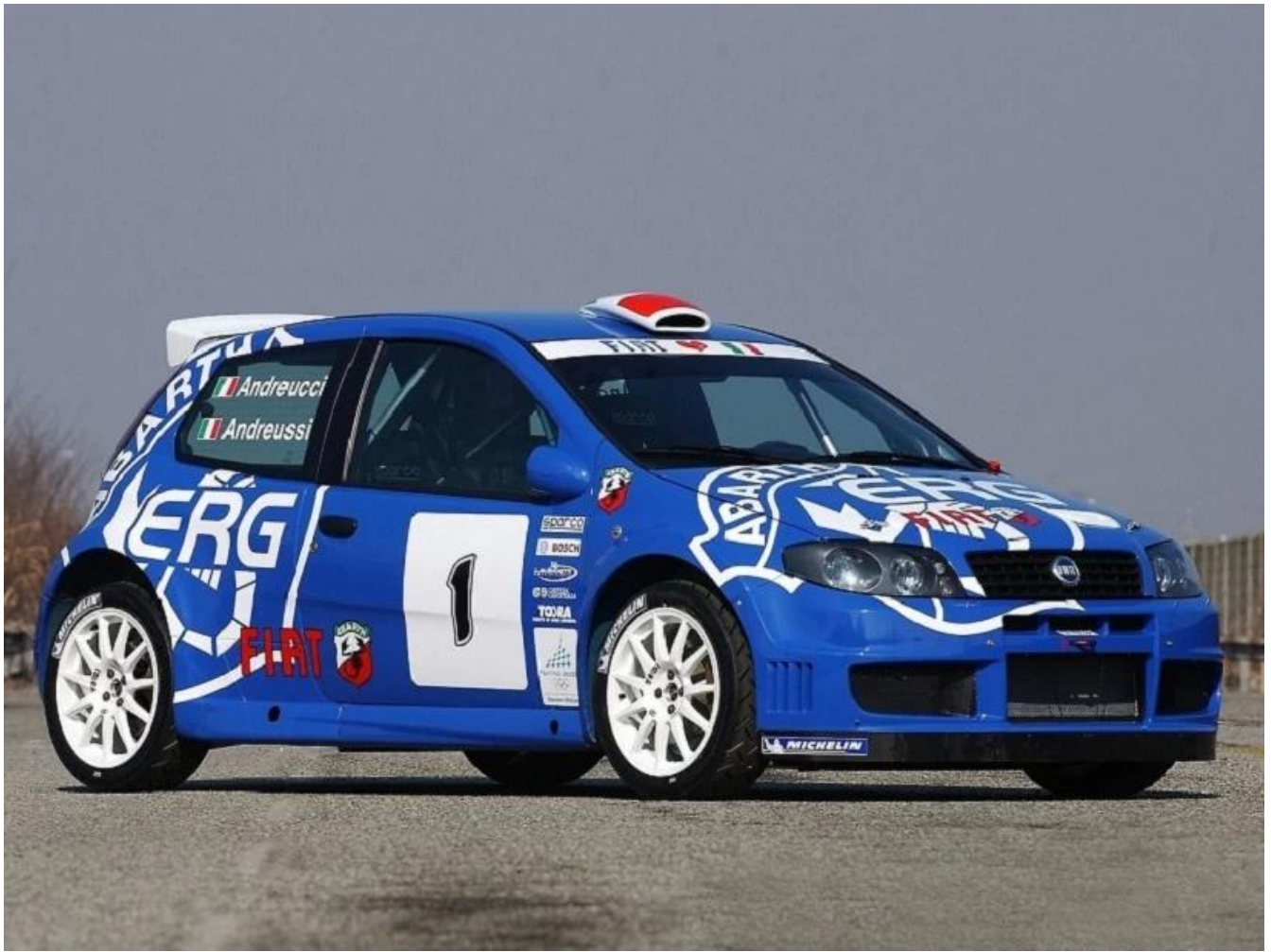
Nota: Imagen de Pinterest