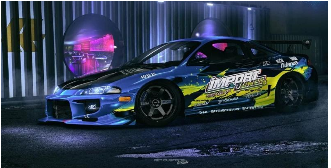
Hinweis: Bild von Pinterest.