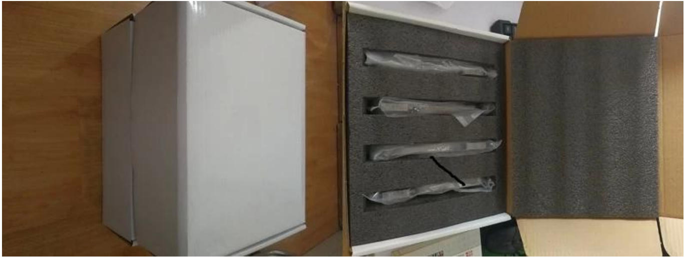
B: Neutrales Paket