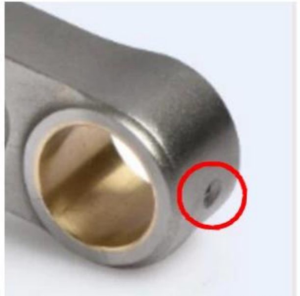
one oil reservoir: I-beam, X-beam