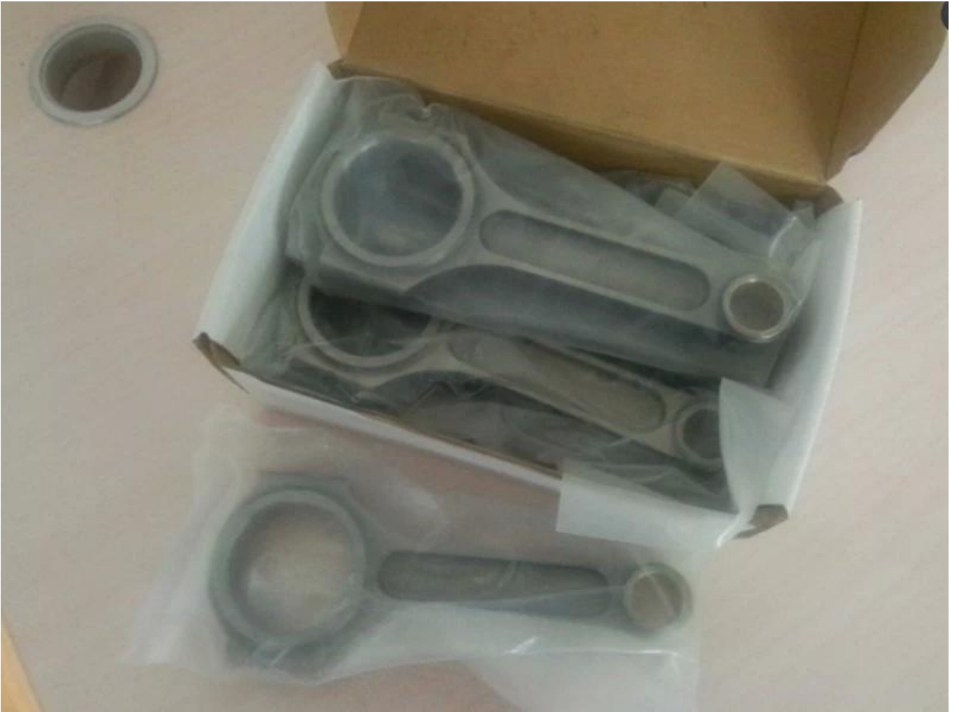
Nissan Skyline Auto Bild