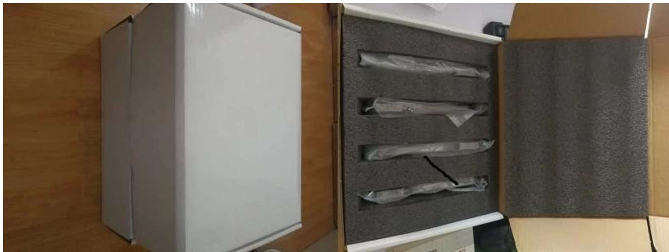
B: pacchetto neutro