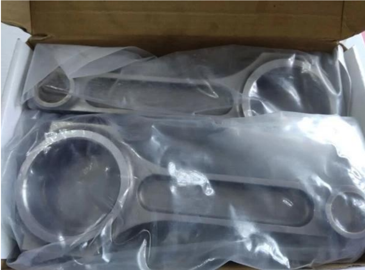
Proceso de producción de bielas